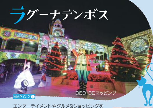
MAP C-2 ①