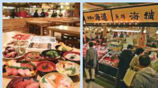
▲フェスティバルマーケット