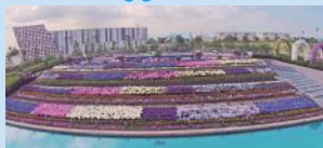
▲フラワーラグーン